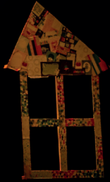
Tres ventanas de papel 1.2 m x 0.8 m