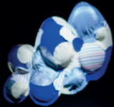
Tres nubes de tela 0.8 m x 1 m