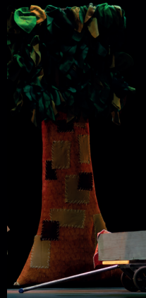
Un arbol de tela 2 m x 1 m