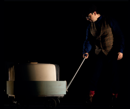
Una carretilla de 74 cm x 54 cm x 40 cm