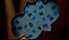
Tres nubes de papel 0.8 m x 1 m